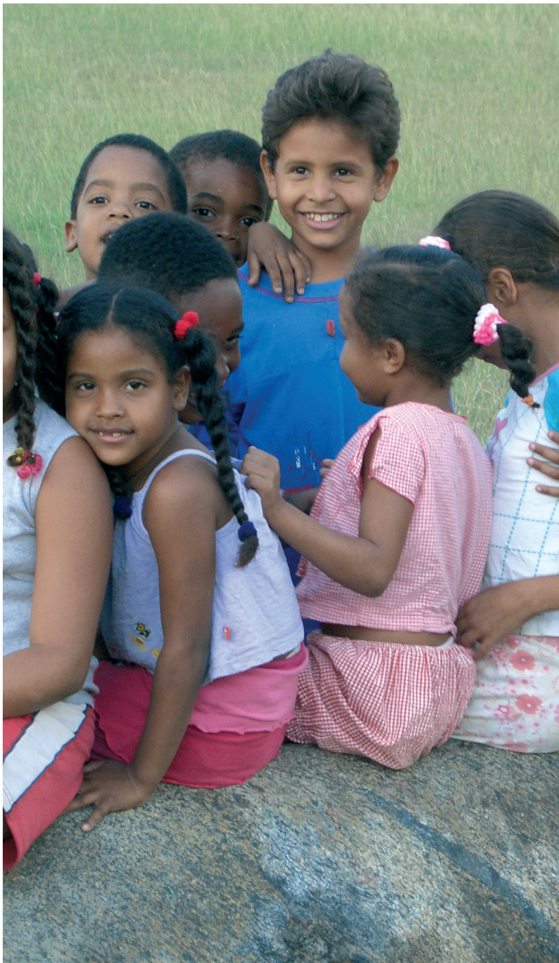
Grupo de niños/as en San Juan de la Maguana (República Dominicana)