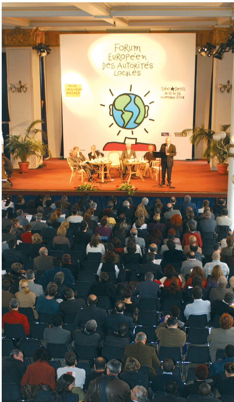
Foro Europeo de Autoridades Locales. Saint Denis (noviembre 2003)